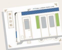
開運御縁線巡り専用のオリジナル御朱印帳