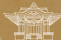
柏駅 × 柏神社